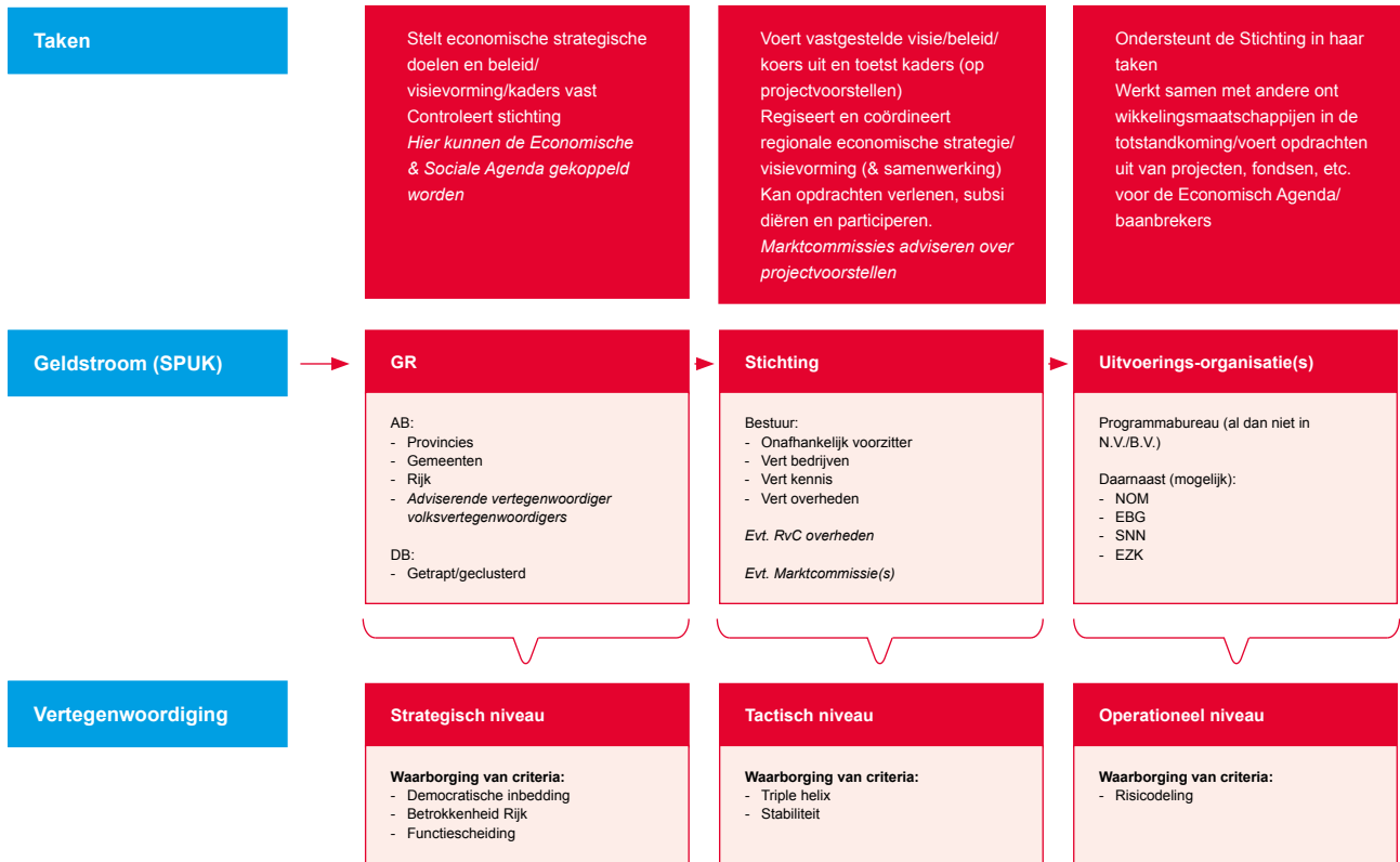
Figuur 2 Triple-Helix model uit Aan het stuur, voor de regio

Het Triple-Helix model is een gelaagd governance-model van rechtsvormen die in gezamenlijkheid voldoen aan de zes criteria van het afwegingskader. Binnen dit model zijn er ook keuzemogelijkheden, bijvoorbeeld met betrekking tot de wijze waarop (maatschappelijke) organisaties betrokken worden of hoe tussen betrokken spelers verantwoording wordt afgelegd. Het betreft een model met 3 lagen: GR-Stichting- Overheidsonderneming(en). Op het strategische niveau worden de economische visie en kaders vastgesteld door de GR, met daarin een bestuurlijke vertegenwoordiging. Onder de GR voert de Stichting de vastgestelde visie uit en toetst project- en programmavoorstellen (al dan niet met behulp van marktcommissies), regisseert en coördineert.